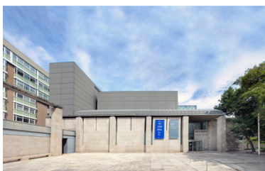
Fachada do Museo de Belas Artes de A Coruña