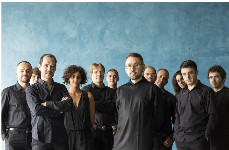
Vertixe Sonora Ensemble.

Desde a súa aparición en 2010, Vertixe Sonora converteuse nun auténtico revulsivo da sociedade galega. A súa permanente estrea de obras novas permite que Galicia participe da creación sonora internacional cun protagonismo activo e desafiante. Un referente para a última xeración internacional de compositores que atopa nas súas producións a oportunidade de desenvolver propostas musicais cunha perspectiva global en permanente estado de convulsión, na procura da excelencia artística.