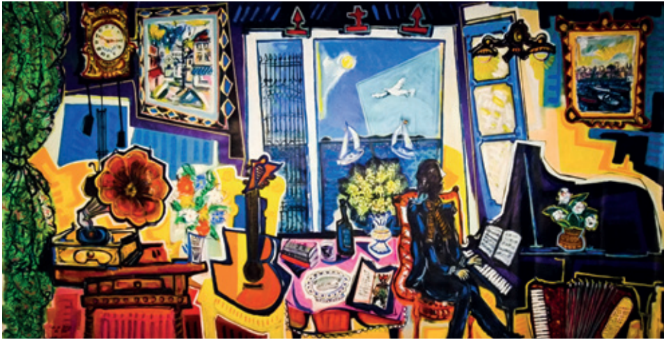
Vivencias , 2021 © Barreiro, VEGAP, Santiago de Compostela, 2023