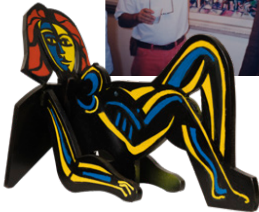
La modelo , 2015 © Barreiro, VEGAP, Santiago de Compostela, 2023