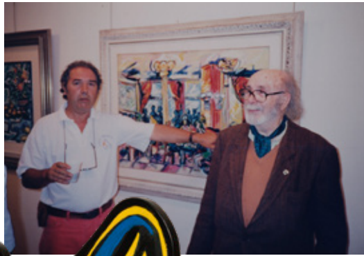
José María Barreiro con Laxeiro