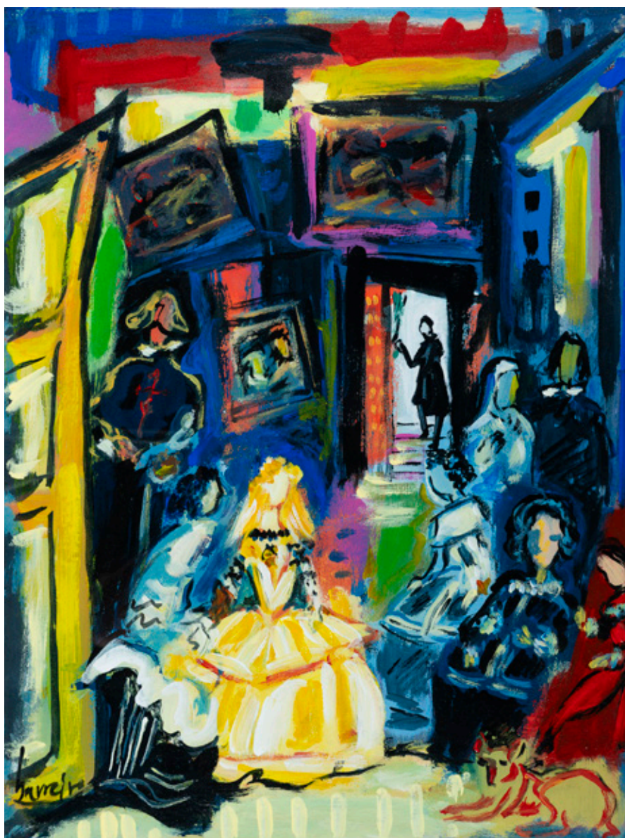
Meninas 3 , 2000 © Barreiro, VEGAP, Santiago de Compostela, 2023

A mostra quere evocar a actualidade da súa pintura, reconsiderando a totalidade do seu proxecto abarcado dende os seus numerosos temas. Son temas que falan de recordos, corpos espidos femininos, gaiteros, músicos e instrumentos musicais, concertos, margaridas, flores de toxo, vaixelas ou naturezas mortas. Na súa obra tamén se atopan amplas atmosferas como interiores de café ou monumentos, o silencio do seu taller, aquilo que está detrás da súa grande icona, a xanela, convertido en embarcación, illa ou mar aberto, montaña ou sorprendente solpor.