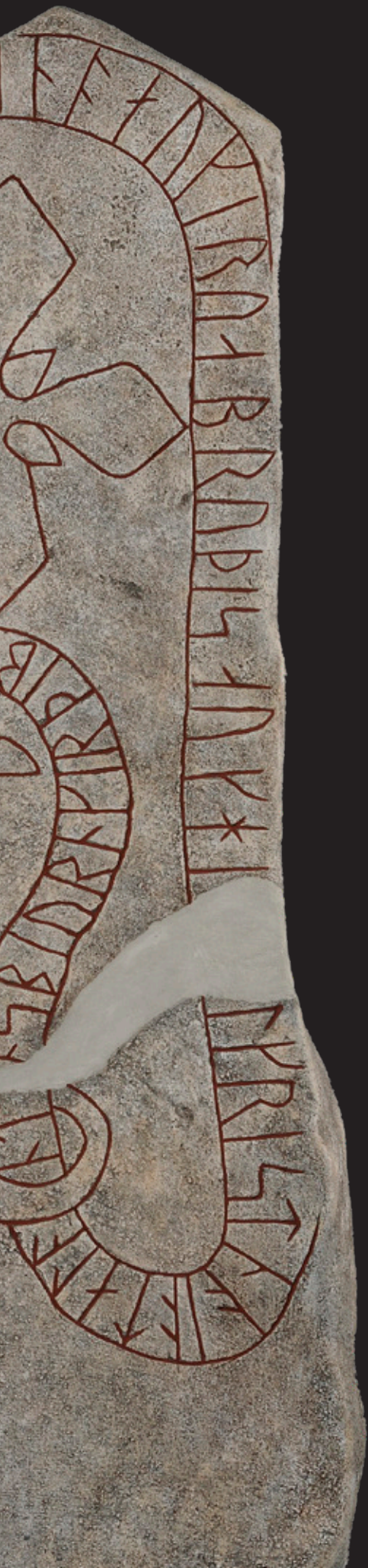
Pedra rúnica (copia) Statens Historiska Museer