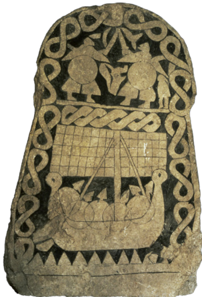
Pedra pictórica Smis con barco e guerreiros. Statens Historiska Museer.

A exposición internacional Unha vida viquinga é un dos proxectos máis destacados da programación da Cidade da Cultura para 2024. Comprende arredor de 120 pezas, das que un centenar proceden de fóra de España e pertencen a museos de historia e arqueoloxía de referencia en Europa arredor da cultura viquinga, entre eles catro museos nacionais e unha biblioteca nacional.