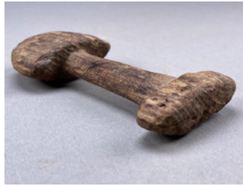
Espada de madeira de xoguete

Ademais, dentro dun modelo de presentación da historia feminista e inclusivo, a mostra afástase de discursos hipermasculinizantes que por veces dominaron o relato sobre o mundo viquingo. Todas as seccións da mostra amosarán pezas que representen tanto a mulleres como a homes, por veces rompendo prexuízos e preconceitos sobre os roles de xénero no pasado (algún exemplos poden ser un peite como obxecto masculino, ou a presenza de mulleres nas campañas guerreiras ou de exploración). Unha das claves da mostra