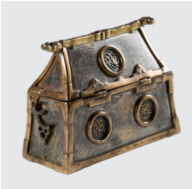
Relicario irlandés con runas, Ranvaik's Casket.

Partindo do título da mostra, o discurso expositivo da mesma presenta seccións temporais percorrendo unha vida viquinga desde a infancia, xuventude e madurez ata a morte e o máis alá, conxugando aspectos da vida cotiá con eventos de distintas épocas que permitan achegarse a esta cultura e comprender o legado da Idade Viquinga, desde a segunda metade do s. VIII ata a segunda metade do s. XI.