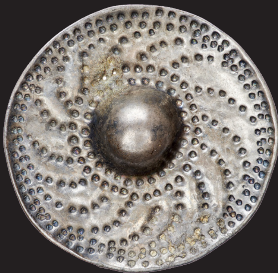
Colgante con forma de escudo Statens Historiska Museer Myrin, Ola, Historiska museet/ SHM (CC BY 4.0)