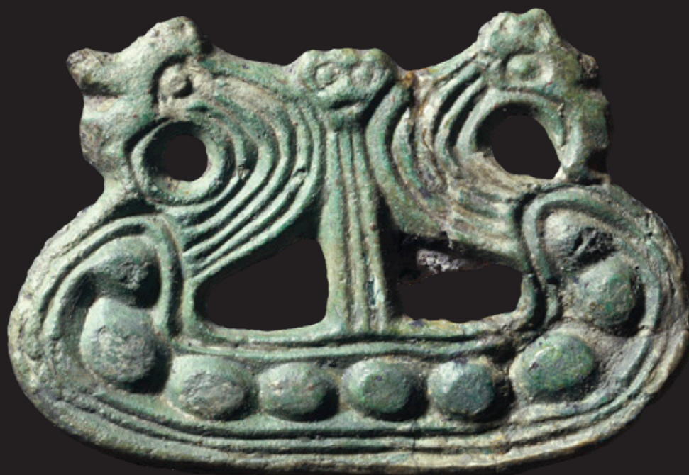
Broche en forma de barco.